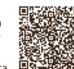
Plànol digitalitzat Plano digitalizado Panoramic views