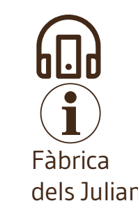
Fàbrica dels Julians