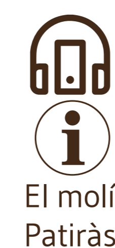
El molí Patiràs

Throughout the walk, we find many rests that have a common denominator: they are water mills. In this ravine, there are three types: flour mills, paper mills and fulling mills. Water mills are buildings that contain machinery that, powered up by water, allowed grain milling (flour mills) or paper production (paper mills). In the case of fulling mills, textile fiber were compacted by the hitting of some tenderisers. Thus, clothes were made.