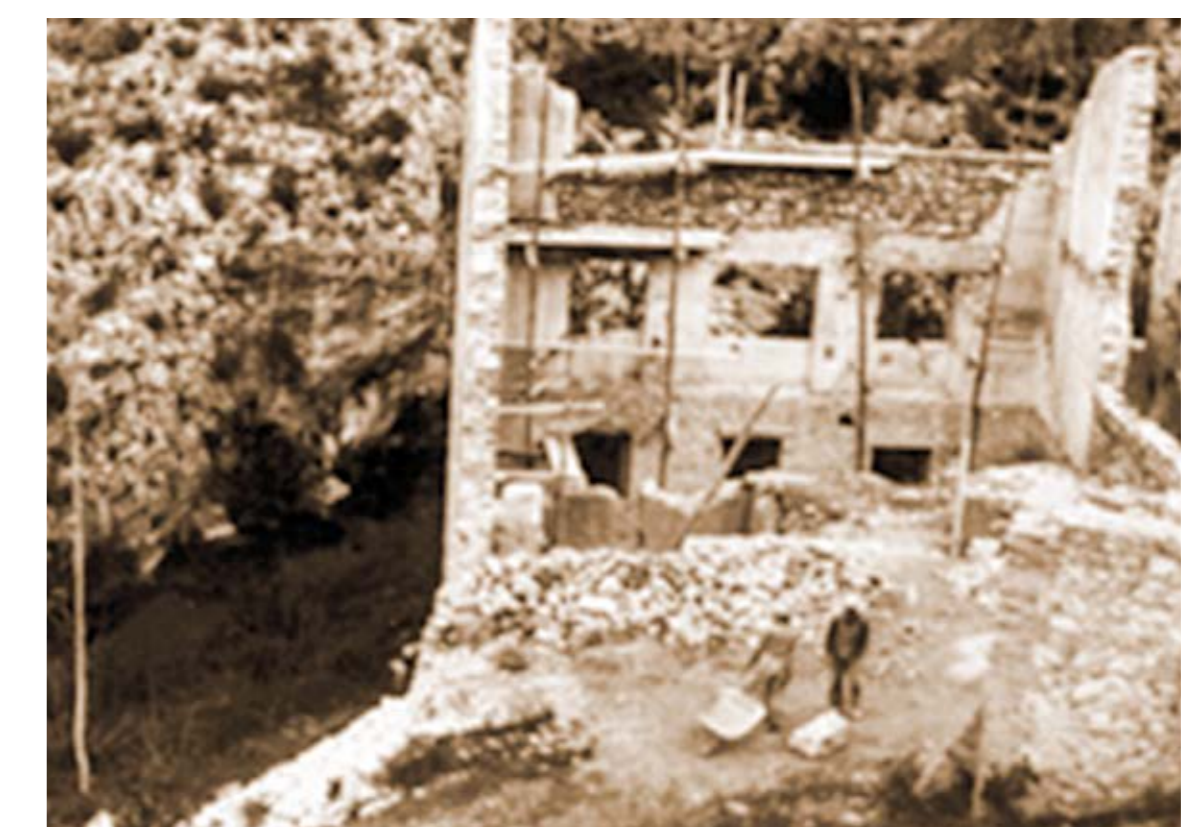
Tasques de reconstrucció del molí de Patiràs Vell en temps de postguerra.