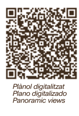
Plano digitalizat Plano digitalizado Panoramic views