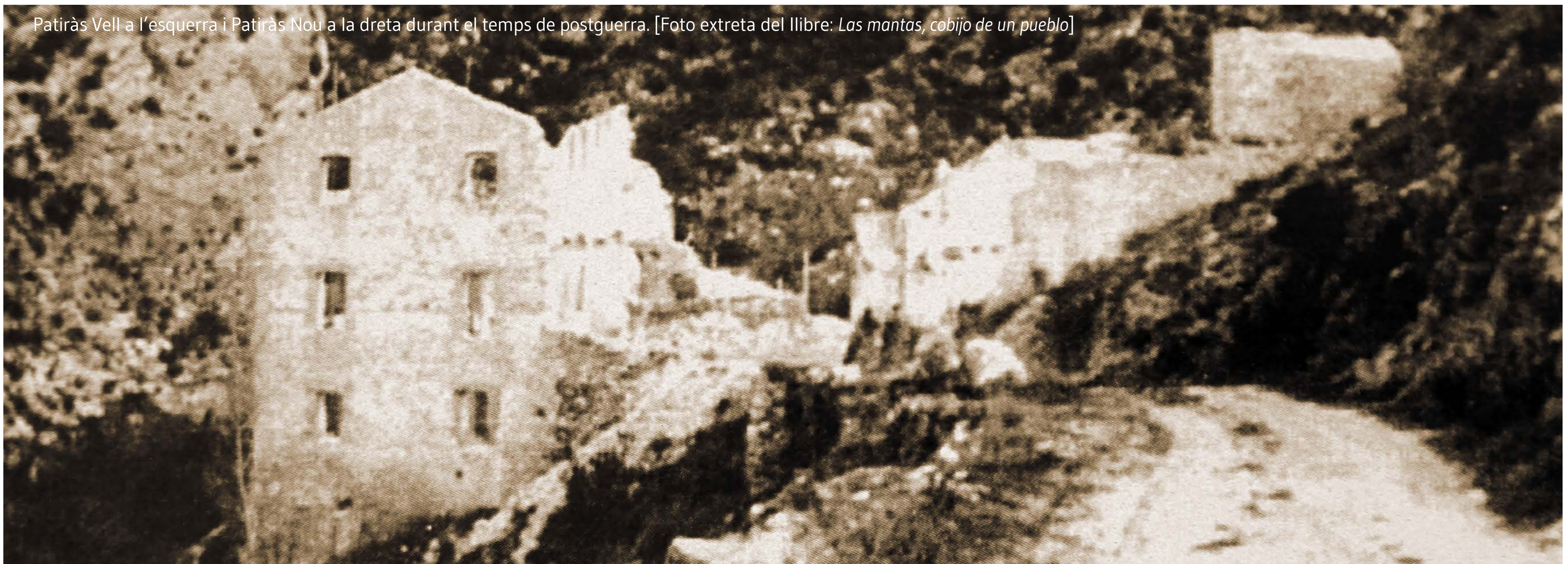
Patiràs Vell a l'esquerra i Patiràs Nou a la dreta durant el temps de postguerra. [Foto extreta del llibre: Las mantas, cobijo de un pueblo ]